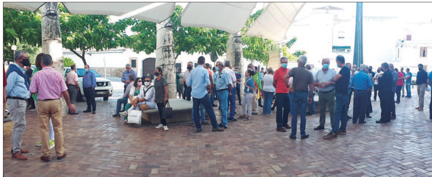
Agricultores se concentraron en las traseras del ayuntamiento para protestar por el precio de la aceituna y plantear un paro en la recogida.

Algunos han planteado paralizar la recogida o hacer la venta a través de subastas, como se hacía antes