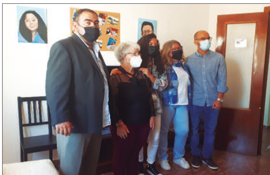
Usuarios, técnicos del programa y la presidenta de Includes, en el piso del programa.

Comenzó en junio y terminará en diciembre. Su presupuesto es de 22.000 euros financiados por Includes y el Sepa. En esta primera fase, han participado seis usuarios. De lunes a jueves residen en un piso alquilado y el fin de semana regresan