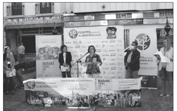
Acto del día de la salud mental organizado por ADAFEMA.