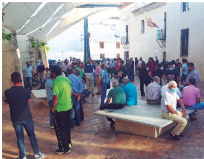
Manifestación convocada por La Unión para reclamar precios justos. Concentración de agricultores en las traseras del ayuntamiento.