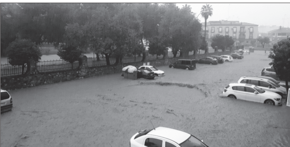
Inundación de la avenida de Goya a primera hora de la mañana.