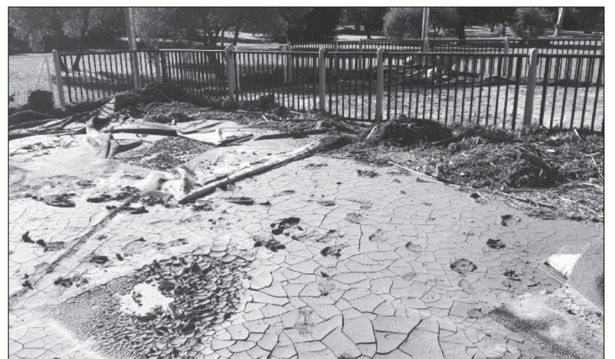
Una pista deportiva del parque Las Mercedes quedó llena de barro.