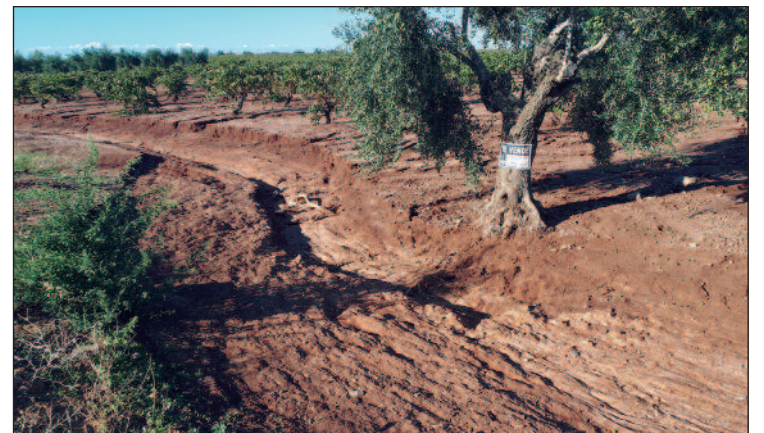
Daños que hicieron las fuertes lluvias en algunas parcelas agrícolas.

Unas dos horas después la corriente fue disminuyendo, dejando auténticos lodazales en las calles, comercios, tiendas, empresas, viviendas, garajes y vehículos. También dejaba a una población desolada, incrédula a lo que acaba de vivir, después de tantos años y a pesar de las alertas del 112, y preocupada por lo que iba a pasar con sus bienes. Rápidamente, los