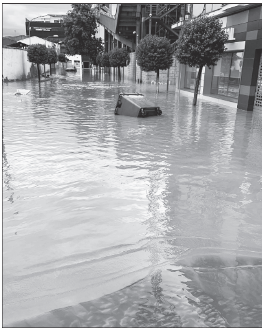
Inundación de las traseras del campo de fútbol y cómo quedó después de pasar el agua, en la calle Fray Alonso Cabezas.