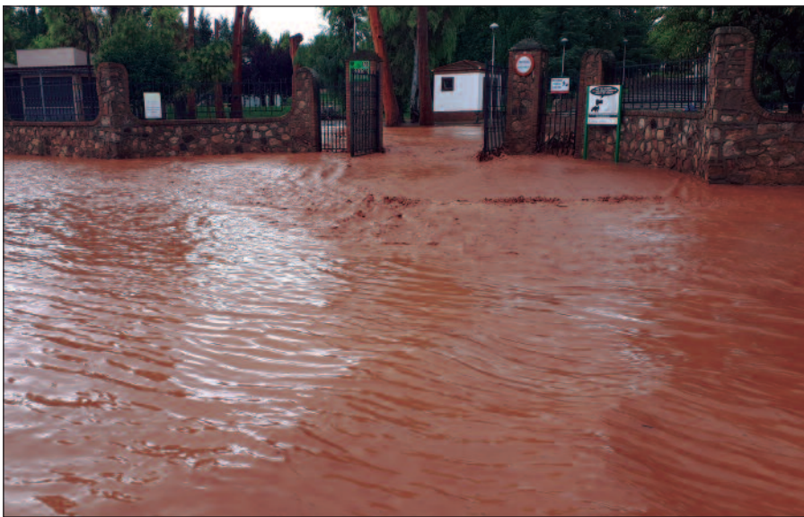
La riada a su paso por la puerta del parque de Las Mercedes de la avenida de Goya.