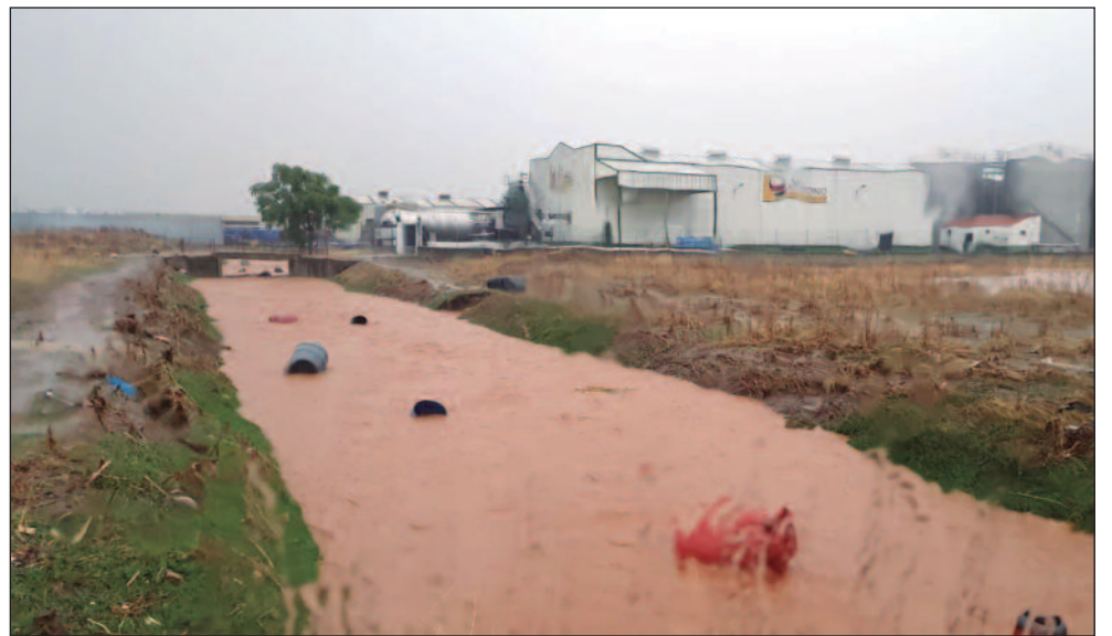
Bidones de las fábricas de aceituna son arrastrados por la corriente en el arroyo Las Picadas.

Una DANA el 23 de septiembre provocó inundaciones en la ciudad, causando grandes destrozos y daños materiales, valorados inicialmente en más de 800.000 euros