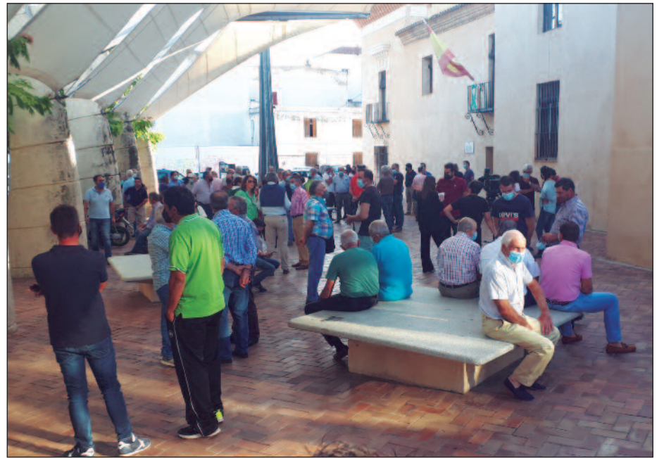
Agricultores de Almendralejo se concentraron en el ayuntamiento en señal de protesta.

CHG autoriza la captación de agua de las presas de Alange y Villalba para el regadío