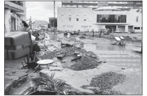
Estado en el que quedó la plaza Extremadura.