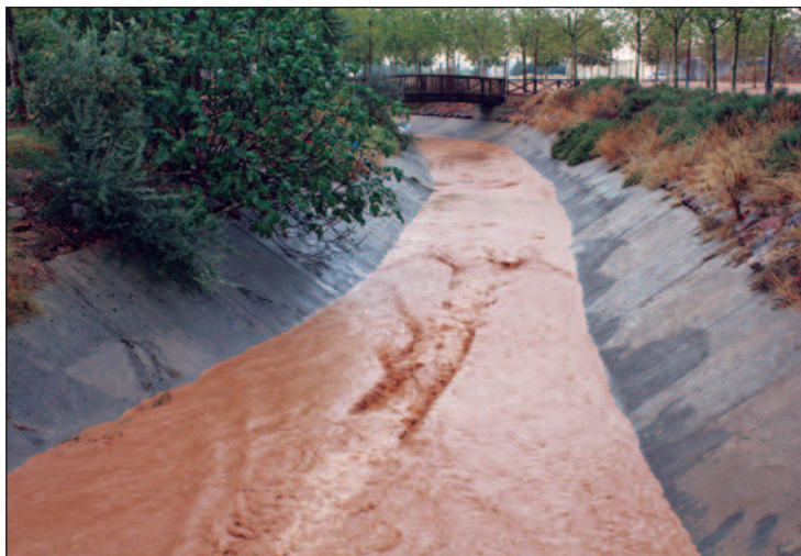
El cauce del arroyo a su paro por el ferial aumentó tras las lluvias.

Tras una tormentosa noche, el día comenzó con carreteras cortadas, tanto autovías como nacionales, por acumulación y balsas de agua. La zona del recinto ferial ya presentaba inundaciones, provocando daños en algunas empresas. Destacaba los miles de bidones de aceitunas arrastrados por las corrientes desde sus fábricas hasta el recinto ferial y la carretera de Badajoz. Incluso algunos llegaron hasta Solana de los Barros. Poco después, el agua procedente de Villafranca de los Barros corría por la alberca e inundaba el parque de Las Mer-