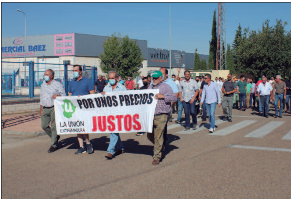
Manifestación convocada por La Unión Extremadura en Almendralejo.

Han protagonizado varias protestas en el último mes, en plena campaña, ya que el kilo de aceituna tiene un precio por debajo del euro y no cubre los costes de producción. Asociaciones agrarias han denunciado ante la AICA el incumplimiento de la ley de Cadena Alimentaria este tipo de compras.