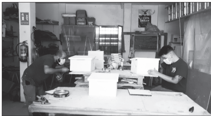
Taller de nidos artesanos para varias aves en DEMA.