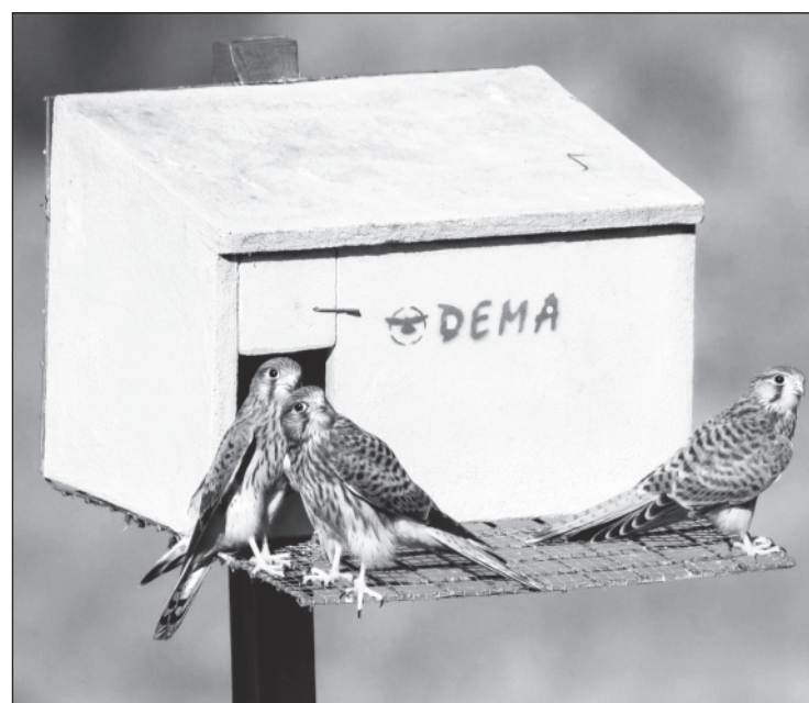
Soporte que se ha incluido en los nidos de cernícalos para mejorarlos.

Según Antolín, la clave del éxito de estas casas radica en sus detalles y es que, tras la observación minuciosa del comportamiento de las aves, han plasmado en los nidos las necesidades o problemas que ellas tienen. Por ejemplo, el orificio circular por donde acceden los cernícalos al interior del nido y una pieza especial en forma de rampa, impiden que, otras aves como la grajilla, puedan entrar y comerse a los pollos. Unas ranuras horizontales bajo la entrada permiten