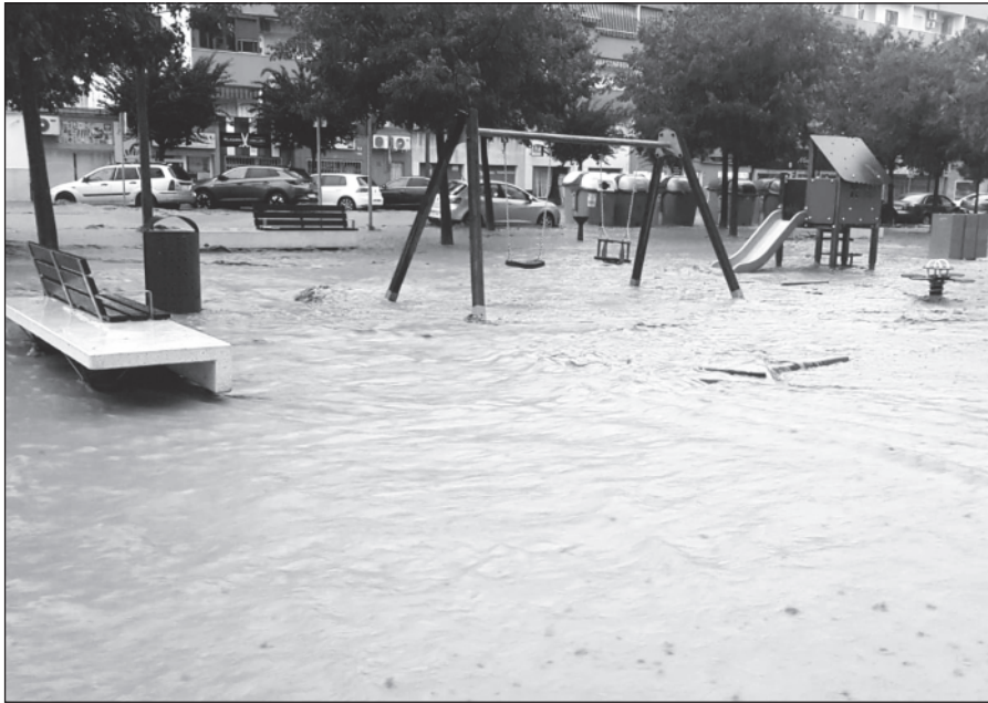
La avenida de la Paz quedó completamente inundada.