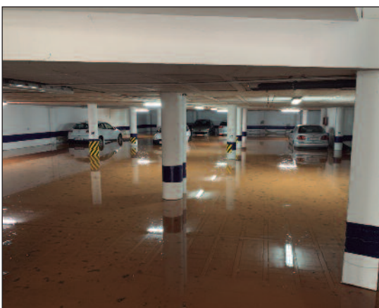
Uno de los garajes que sufrieron inundaciones.

cedes, la avenida de Goya, la calle Jaraíz y la avenida de la Paz, llegando a una plaza de Extremadura en obras que estrenaba sus nuevos colectores de saneamiento de mayor dimensiones, que en esta ocasión se quedaron cortos. Ahí se juntaba el agua procedente de las calles Francisco Pizarro, el Pilar y Suárez Bárcenas. Y en ese punto de intersección, el agua iba para la carretera de Badajoz, que a pesar de su anchura, entraba en las empresas de la zona. Mientras que la corriente pasaba con mucha fuerza, la población se paralizó pendiente de