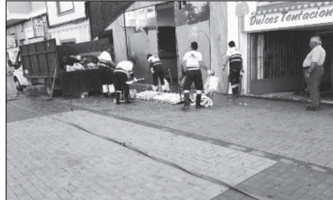
El servicio de limpieza recogen los residuos.