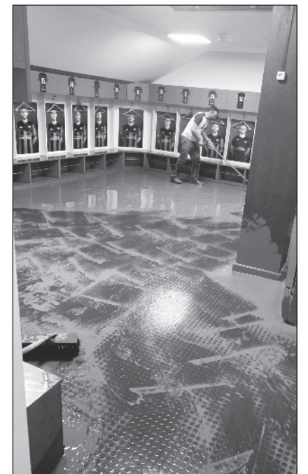
Vestuario del campo de fútbol.