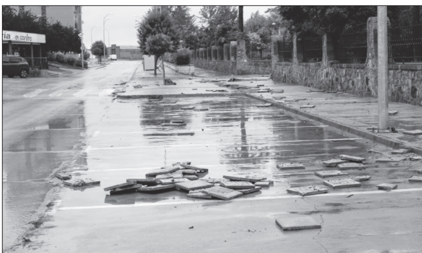
Baldosas levantadas tras el paso de la riada por la avenida de Goya.