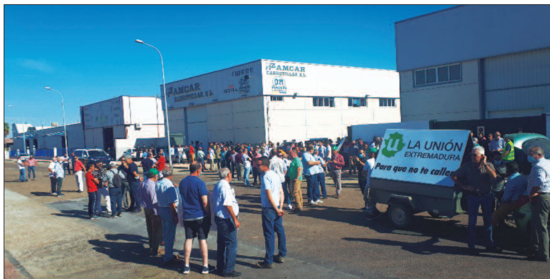
Concentración en las puertas de una fábrica de convocada por La Unión Extremadura.

La siguiente protesta la convocaba La Unión de Extremadura en Almendralejo, secundada por