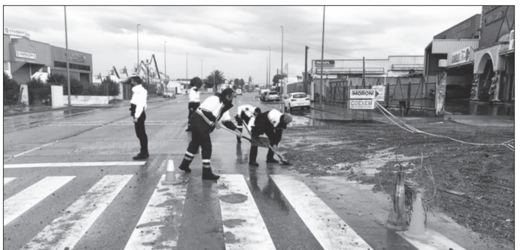
Trabajadores del servicio de limpieza retiran el lodo de la carretera de Badajoz.