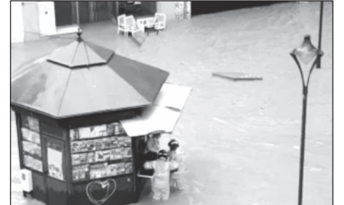
Los bomberos rescatan a una mujer.