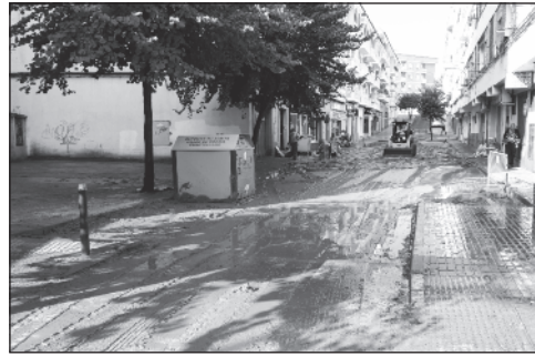
Una grúa retira el barro de la calle Venezuela.