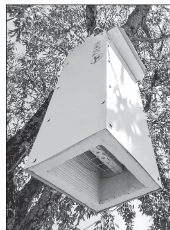
Nidos de murciélagos.

que las garras del ave se enganchen para acceder al interior.